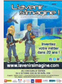
L'avenir s' imagine