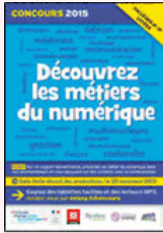
LI_ Les métiers du numérique