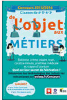
De l'objet aux métiers