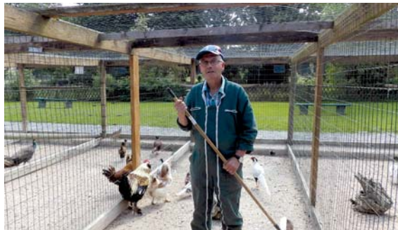
✓ Les cages des poules et des oiseaux.