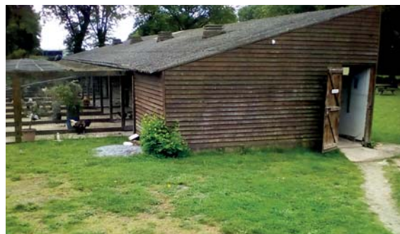
✓ Autour de la volière pour entretenir le site.