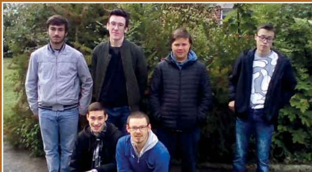
Les reporters : les élèves de SIPFPro, IME Les Ajoncs d'Or de Montfort-sur-Meu, (35).

A l'ESAT, l'équipe de soins aux animaux nourrit les poules, suit les naissances des poussins, donne les traitements médicaux prescrits. Elle entretient aussi les locaux et les cages des poules.