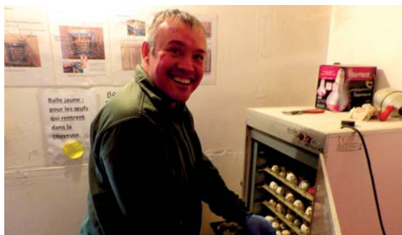
✓ La salle de couveuse.