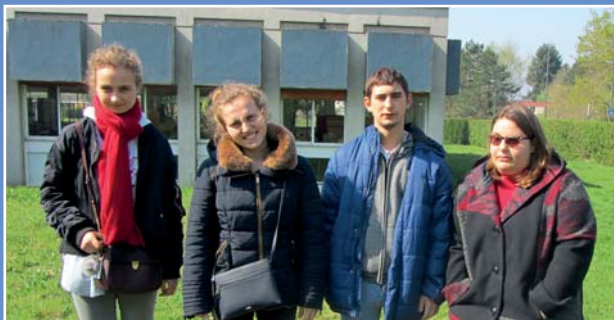
Les reporters : les élèves de SIPFPro de l'IME Hallouvry, Chantepie (35).

En ESAT, l'équipe de repasserie repasse le linge que les clients lui apportent : des chemises, des pantalons, des robes, des draps... En fonction du linge repassé, elle utilise différentes machines.