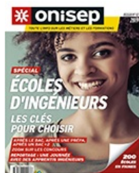
Dossiers : Ecoles d'ingénieurs.