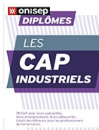
Diplômes : Les CAP industriels.