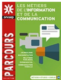
Parcours : Les métiers de l'information et de la communication.