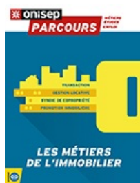
Parcours : Les métiers de l'immobilier.