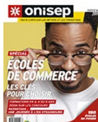
Dossiers : Ecoles de commerce.