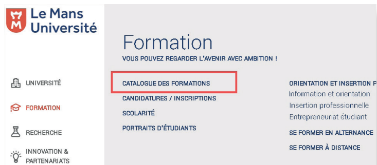
Figure 2 : Accès à l'offre de formation de l'université du Maine.

- Puis sur le lien : « Catalogue des formations ».