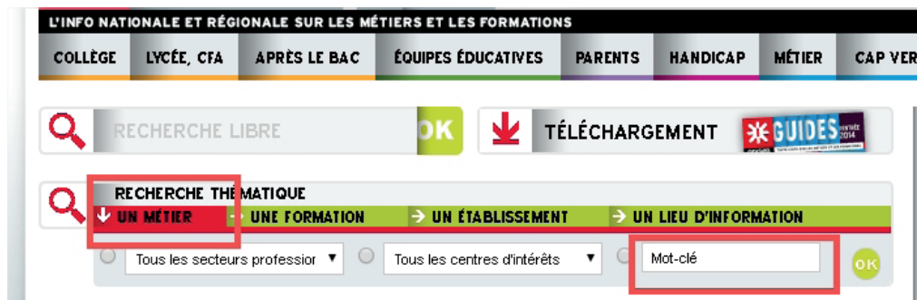
Figure 4 : Moteur de recherche métiers sur www.onisep.fr

Rendez-vous sur Onisep.fr pour chercher des informations complémentaires sur le métier retenu. Ouvrez un nouvel onglet, et saisissez le nom du métier dans le moteur de recherche Onisep. Utilisez l'autocomplétion pour obtenir plus de réussite sur votre recherche depuis le champ mot-clé.