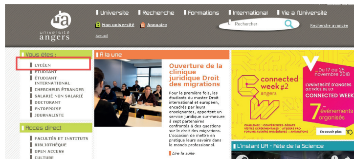
Figure 1 : page d'accueil du site de l'université d'Angers