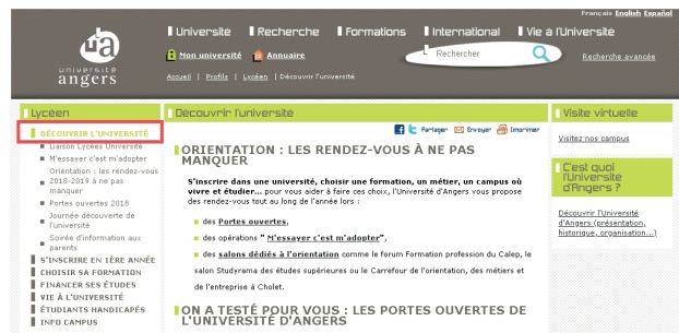
Figure 2 : Accès au site lycéen de l'université d'Angers

- Enregistrez cette page comme Marque page (sous Firefox), Favoris (Chrome et Internet Explorer), Signets (Opéra ou Safari) sur cette entrée.