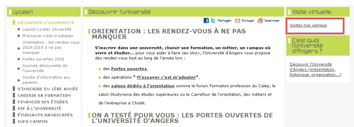
Figure 3 : Les différents campus de l'université d'Angers

- Cliquez sur le lien : « Découvrir l'université ».