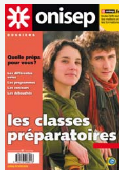
Les classes préparatoires. Coll. « Dossiers », 2009