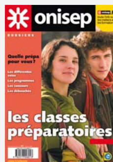
Les classes préparatoires , Coll. « Dossiers », 2009