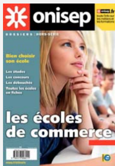
Les écoles de commerce. Coll. « Dossiers »