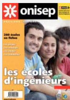
Les écoles d'ingénieurs , coll. « Dossiers », 2009

Publications : www.onisep.fr/lalibrairie