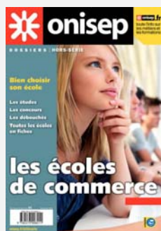
Les écoles de commerce , Coll. « Dossiers »