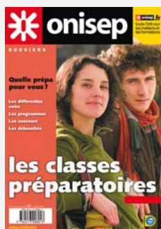
Les classes préparatoires, Coll. « Dossiers », 2009